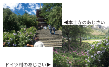
ドイツ村のあじさい▶ ▶▶ 本土寺のあじさい

5月になれば佐倉市の民族博物館の菖蒲畑、そして紫陽花の時期は、松戸の本土寺やドイツ村も壮観です。ドイツ村のあじさいは本土寺よりもボリュームがあり、予想以上の景色を楽しめると思います。