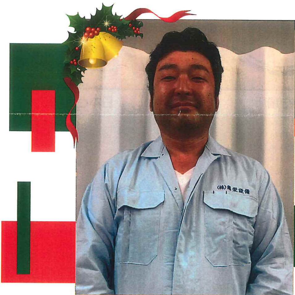
2020年 お疲れさまでした!