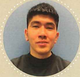
クアック コン クアン